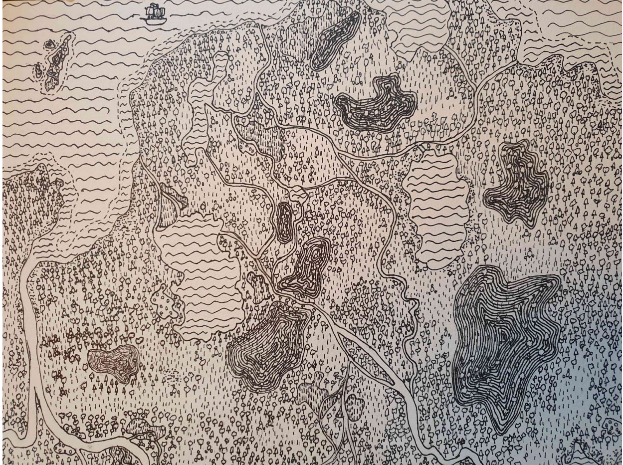
Toms Kārlis Auziņš 5.klase 2020.