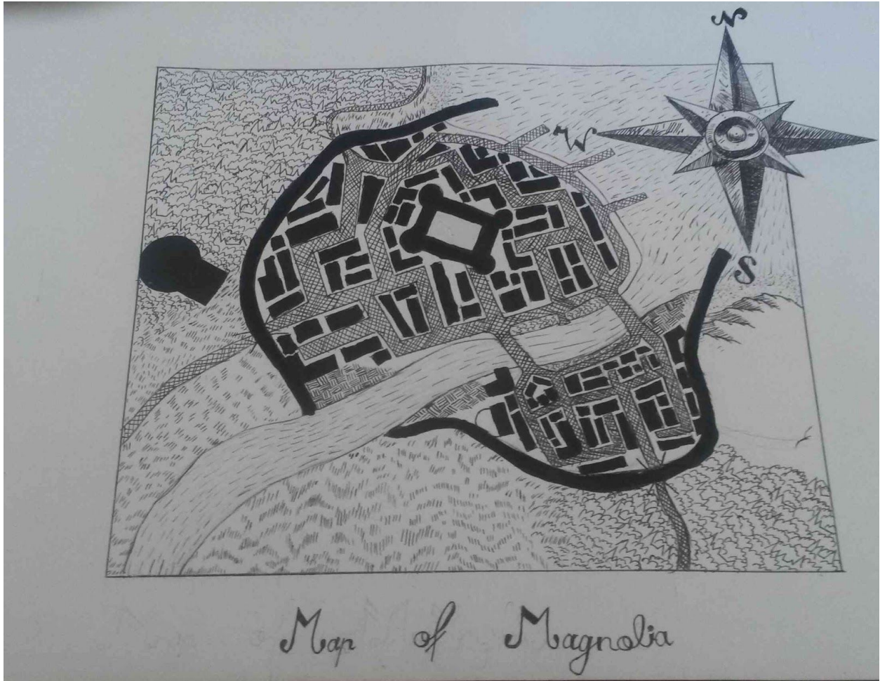
Elza Porniece 5.klase 2020.