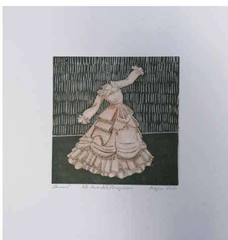
Dagnija Maija Krēgere «Blaumanis», linogravūrs, sausā adata, uz papīra 2023, Klišeju izmēri - 15 cm x 15 cm