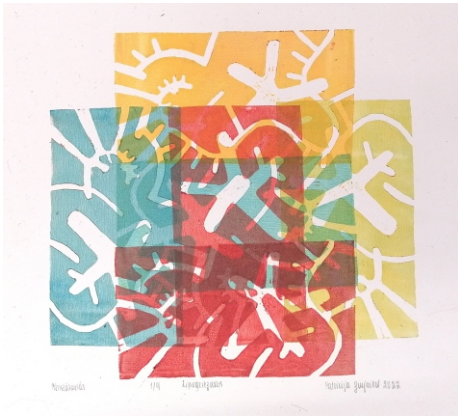
Patrīcija Paula Zvejniece «Pārklāšanās», linogriezums, papīrs, 2022. 20 x 20 cm