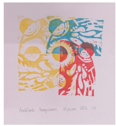
Zelta Jansone «Pārklāšanās», linogriezums, papīrs, 2022. 20 x 20 cm