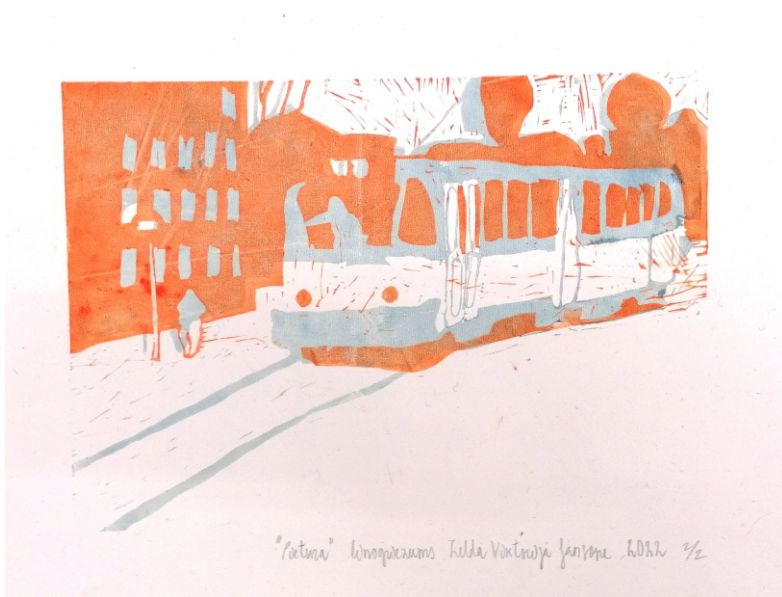
Zelta Jansone «Pietura», linogriezums, papīrs, 2022. 35 x 20 cm