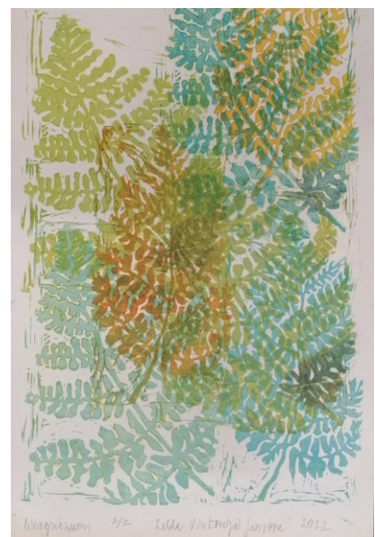
Zelta Jansone «Pietura», linogriezums, papīrs, 2022. 30 x 15 cm