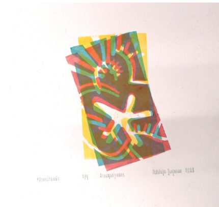
Patrīcija Paula Zvejniece «Pārklāšanās», linogriezums, papīrs, 2022. 20 x 20 cm